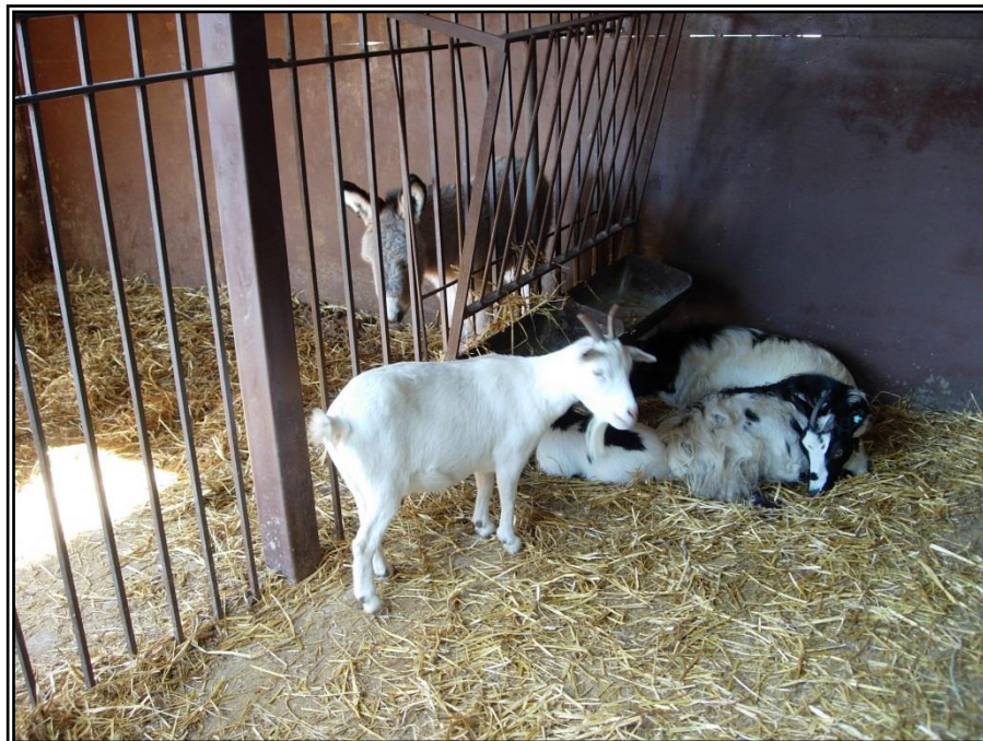
Figura 22: Alcuni animali della Fattoria Didattica