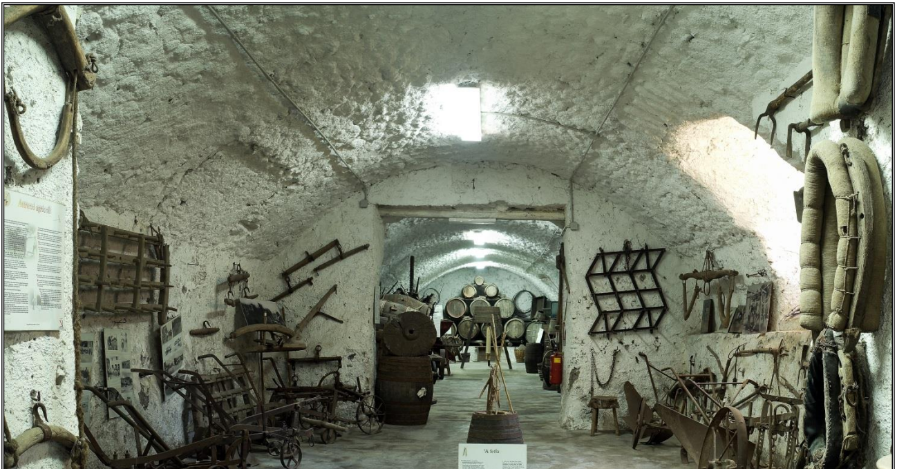
Figura 1: Sala degli attrezzi agricoli

Vengono documentati in questo settore i sistemi di trasporto usati nel lavoro dei contadini e nelle attività di scambio (circa 30 pz.): trasporto mediante animali da soma o con veicoli a trazione animale. Sono esposti basti e gioghi per bovini e per equini, singoli o doppi, e veicoli con ruote a trazione animale (carro, carretto a due ruote con timone a due stanghe).