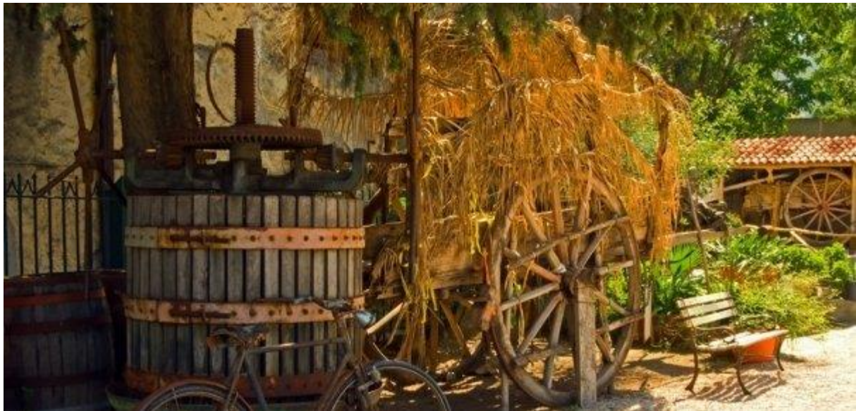
Figura 21: Carri per il trasporto dei prodotti agricoli