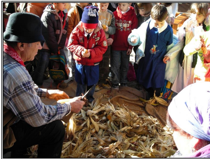
Figura 13: Modulo didattico "il ciclo del mais"