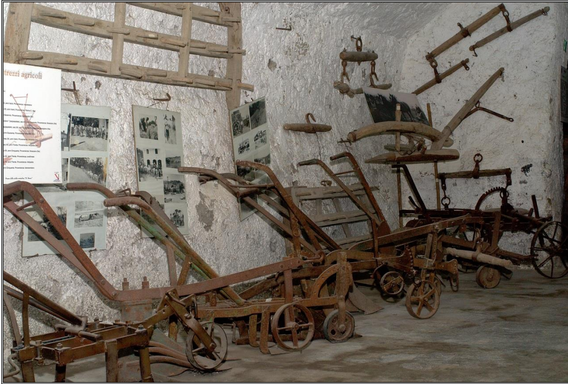
Figura 2: Sala degli attrezzi agricoli - particolare