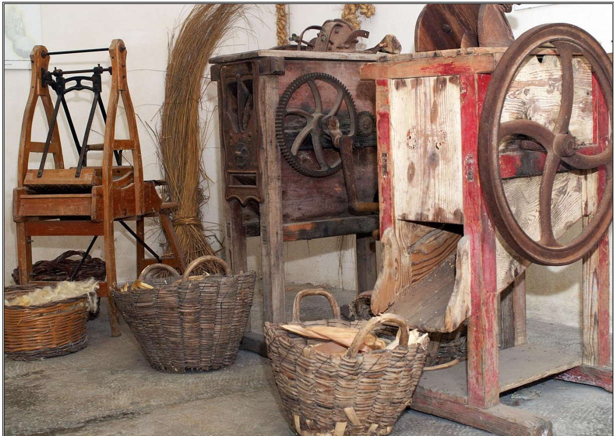
Figura 8: Particolare della lavorazione del granturco (destra) e della lana (sinistra)

Uno spazio è dedicato all'esposizione di gramole e pettini per la lavorazione della canapa. Questa fibra vegetale aveva vari impieghi: corde, tessuti grossolani, sacchi ma anche tessuti per camicie, lenzuola, asciugamani, soles di corda per calzature, e la stoppa veniva usata per chiudere il fasciame delle imbarcazioni o le giunzioni dei barili.