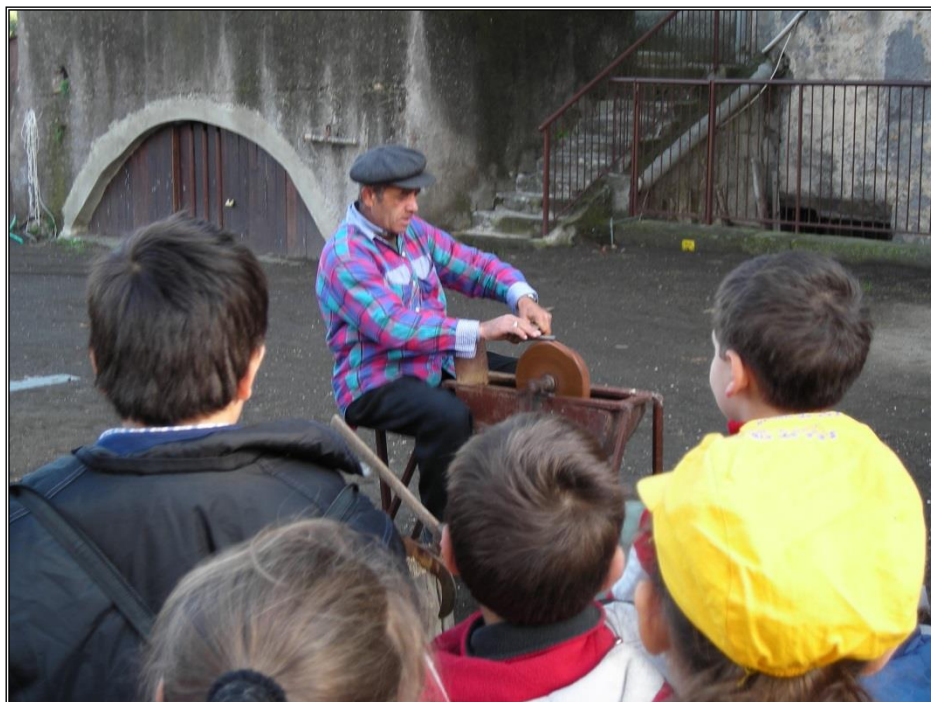
Figura 17: Modulo didattico "i vecchi mestieri": l'arrotino