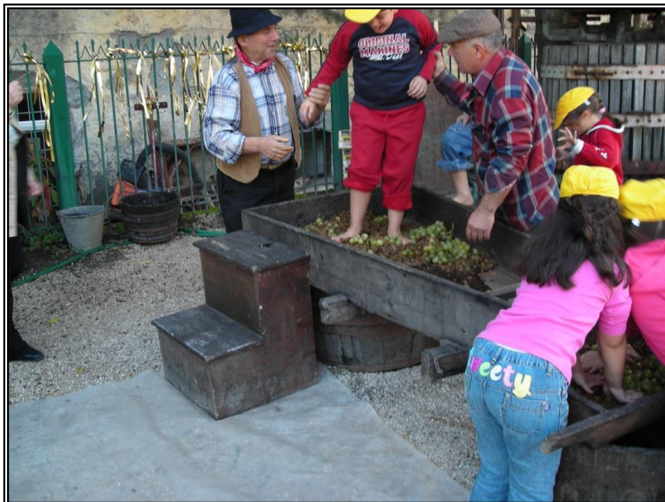
Figura 15: Modulo didattico "La pigiatura dell'uva" effettuata dai bambini con i metodi tradizionali (nella foto, la fase a piedi nudi)