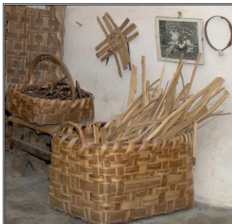
Figura 7: Sala degli antichi mestieri – Il Cestaio