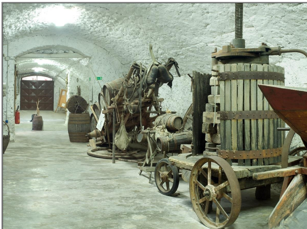
Figura 5: Sala della vite e della vinificazione - particolare