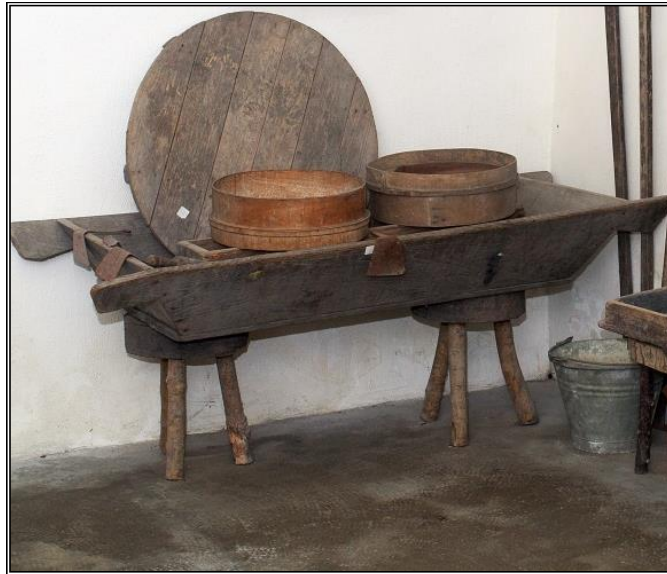
Figura 9: Particolare della sala produzioni alimentari