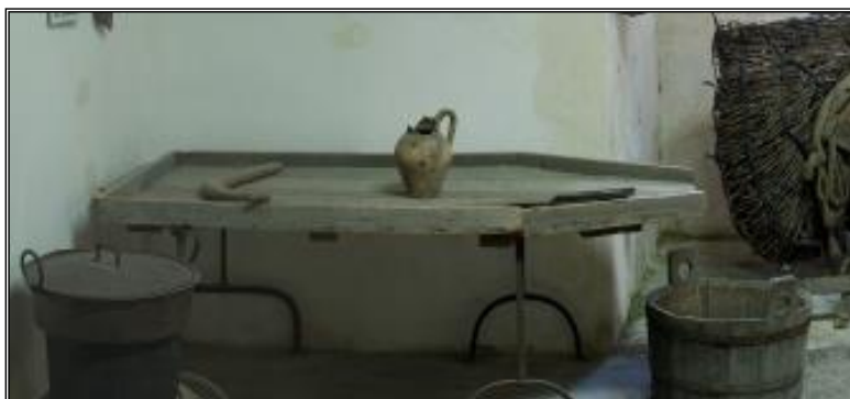
Figura 11: Oggetto sala della maialatura

Lo spazio espositivo espone gli utensili impiegati per l'uccisione e la macellazione del maiale ((circa 10 pz).