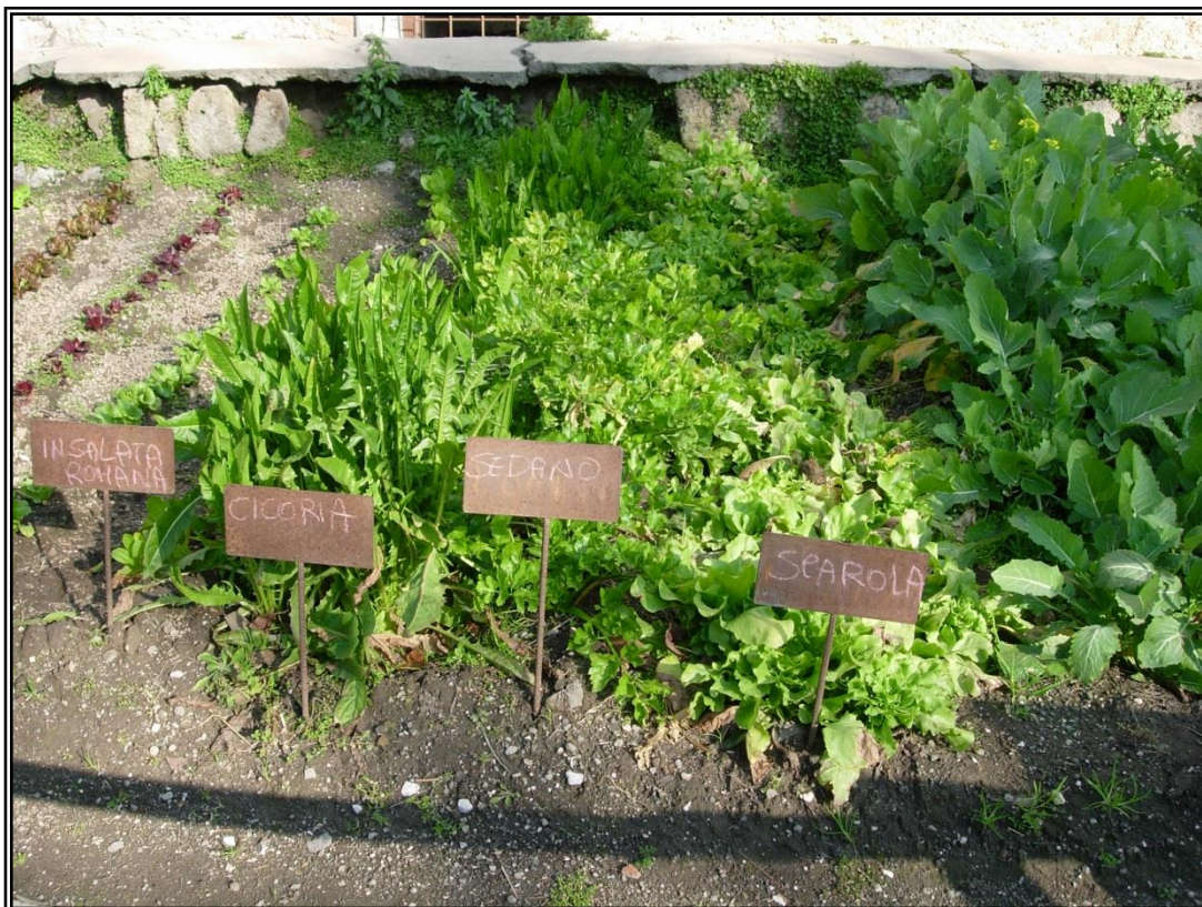
Figura 20: L'orto didattico con le coltivazioni di stagione