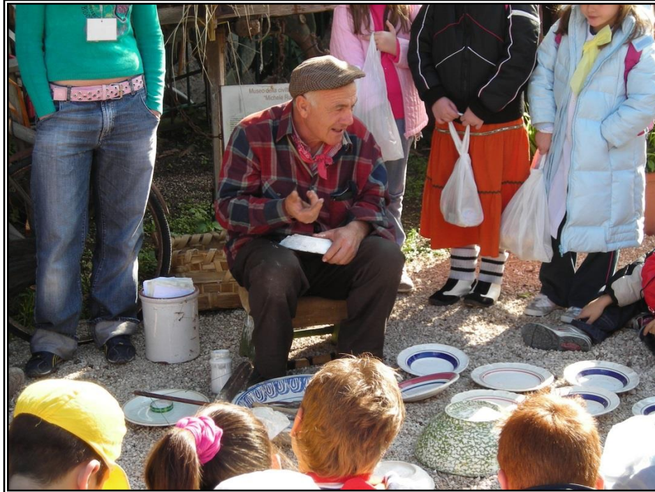
Figura 14: Rappresentazione dei Vecchi Mestieri: il Conciapiatti