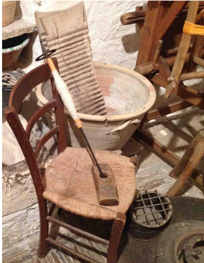
Figura 6: Sala degli antichi mestieri - Lavandaia

(scarparo), arrotino ( molaforbici ), stiratrice ( stiratrice ), cardatore di lana ( cardalana ).