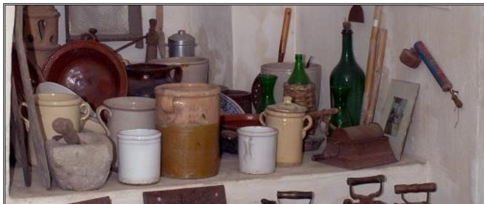
Figura 10: Oggetti alimentazione contadina

Vengono presentati gli oggetti tipici del focolare domestico della casa contadina (circa 40 pz): bilance, pentole, paioli, cucchiaini, recipienti per la conservazione.