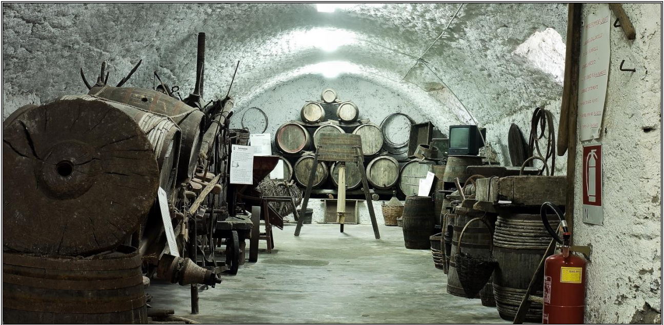
Figura 4: Sala della vite e della vinificazione