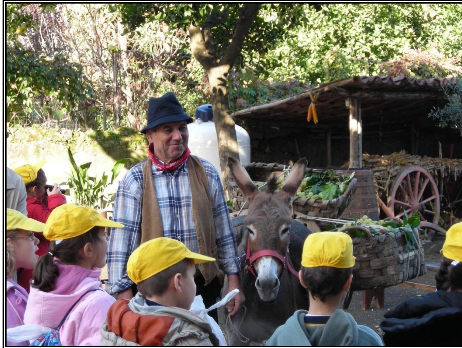
Figura 16: Un "testimone della tradizione" durante una delle spiegazioni agli alunni