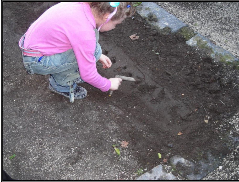
Figura 12: Modulo didattico "La semina"

Di seguito, alcune immagini che documentano le attività didattiche e rappresentative messe in opera dallo staff del Museo Contadino.