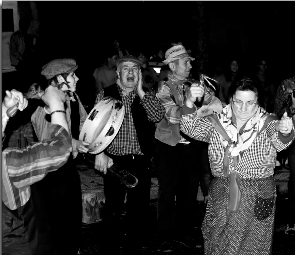
Figura 18: Il gruppo folk del Museo Contadino durante una tammurriata