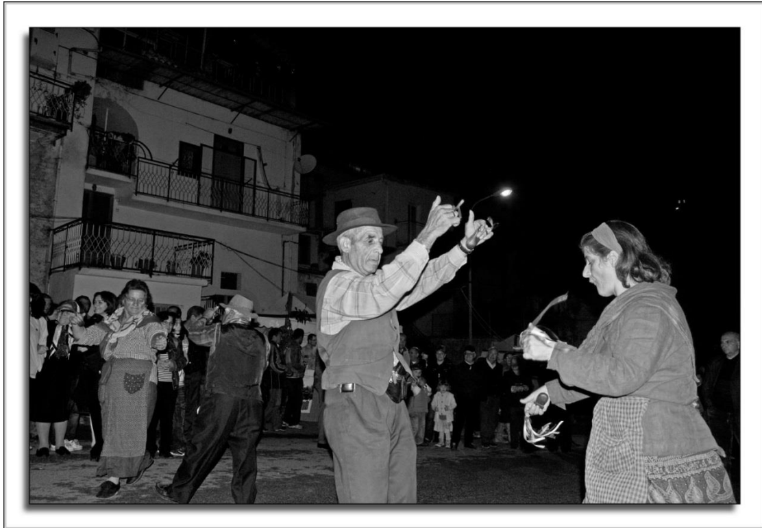
Figura 19: Musiche e balli tradizionali nel corso di una manifestazione esterna al Museo