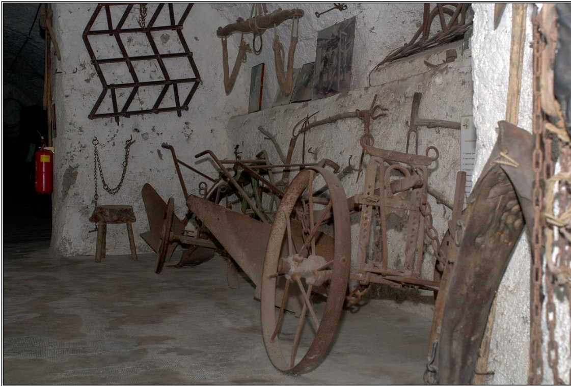
Figura 3: Sala degli attrezzi agricoli - particolare