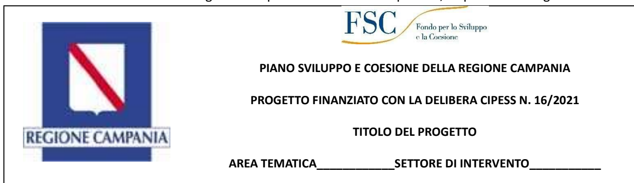
Figura 2. Esempio di spazio informativo